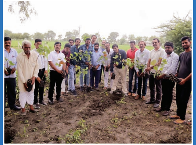
पर्यावरण बचाने का संकल्प लेते हुए चिकित्सक एवं प्रबुद्धजन।